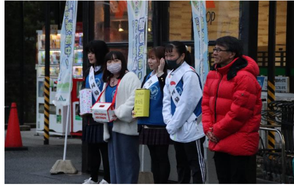
地元の高校生と一緒に能登半島復興の募金運動を行いました