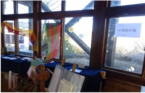
美術の卒業作品展です